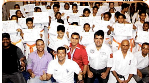
Cerimônia de entrega de certificados e faixas para alunos de Karatê do programa "Esporte Pela Paz"