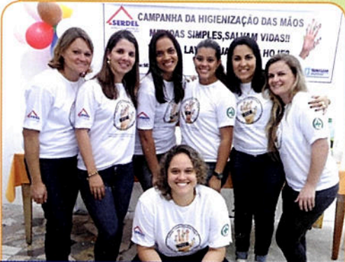
Colaboradores da Serdel em campanha educativa sobre higienização das mãos

No dia 05 de maio foi comemorado o Dia Mundial da Higienização das Mãos e a Serdel abraçou essa causa. O Serviço Especializado em Engenharia de Segurança e Medicina do Trabalho da Serdel (Sesmt) realizou uma campanha de conscientização sobre a importância da higienização das mãos com os colaboradores que atuam na sede da empresa. O tema foi abordado durante um café da manhã, onde os colaboradores foram reunidos e orientados através de demonstração prática de limpeza das mãos a base de álcool em gel. Houve também sorteio de brindes.