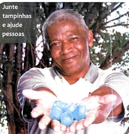
Junte tampinhas e ajude pessoas